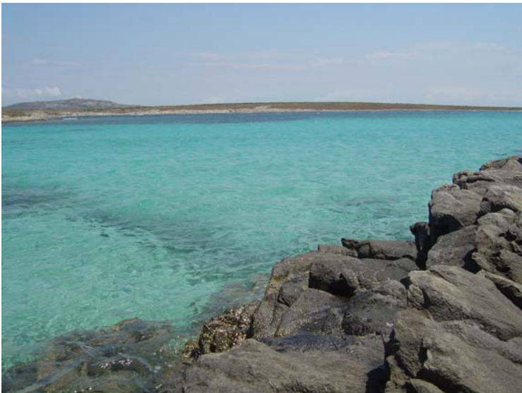
La Spiaggia della Pelosa